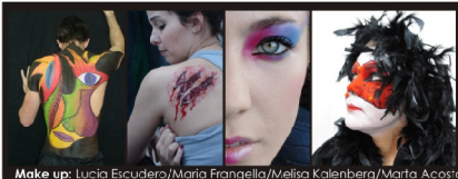
Make up: Lucía Escudero/Maria Frangella/Melisa Kalenberg/Marta Acosio